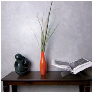
Spatula Stuhhi, venezianische Spachteltechnik